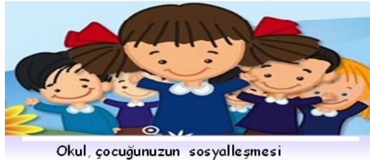
Okul, çocuğunuzun sosyalleşmesi

Aile bireylerinin çocuğun okula gitmesi ile ilgili tutarsız davranışlar sergilemesi.